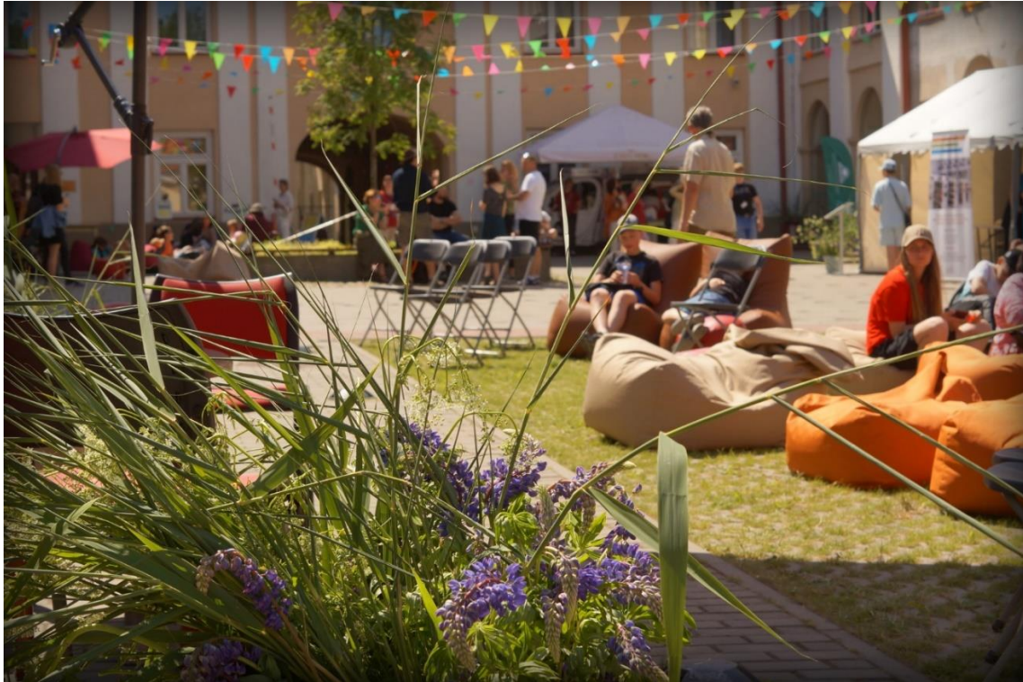
11 pav. Skaitymo festivalio 2023 akimirka

Igyvendinta „Vasara su knyga“ komunikacijos kampanija, skaitytojai dalyvauti akcijoje kviesti įvairiais būdais – kvietimais socialiniuose tinkluose, Facebook žinutėmis ir nuotraukomis, reklaminiame skydelyje informaciniame ekrane, plakatais, skirtukais ir kt. Į akciją aktyviai įsitraukė ir kolegos iš Regiono bibliotekų. 2023 m. su komunikacine kampanija ir naujomis veiklomis startavo naujasis projektas „Metai su knyga“.