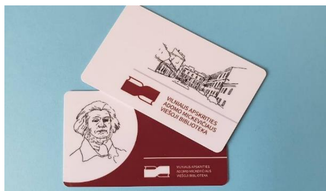
2 pav. Naujo dizaino pažymėjimai