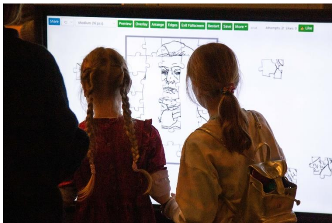
5 pav. Adomo Mickevičiaus bibliotekos standas

Vasario 23 - 26 dienomis Lietuvos parodų ir kongresų centre LITEXPO vykusioje Vilniaus knygų mugėje pristatytos dvi edukacinės programos vaikams ir paaugliams: „Slapto radijo bangomis“ (7-10 metų vaikams) ir „Adomo Mickevičiaus užduočių knygelė“ (9-12 klasių mokiniam). Keturių mugės dienų metu lankytojus kvietėme žaisti viktorinas apie Vilnių ir Adomą Mickevičių išmaniajame ekrane. Bibliotekos standą aplankė apie 1000 lankytojų (5 pav.)