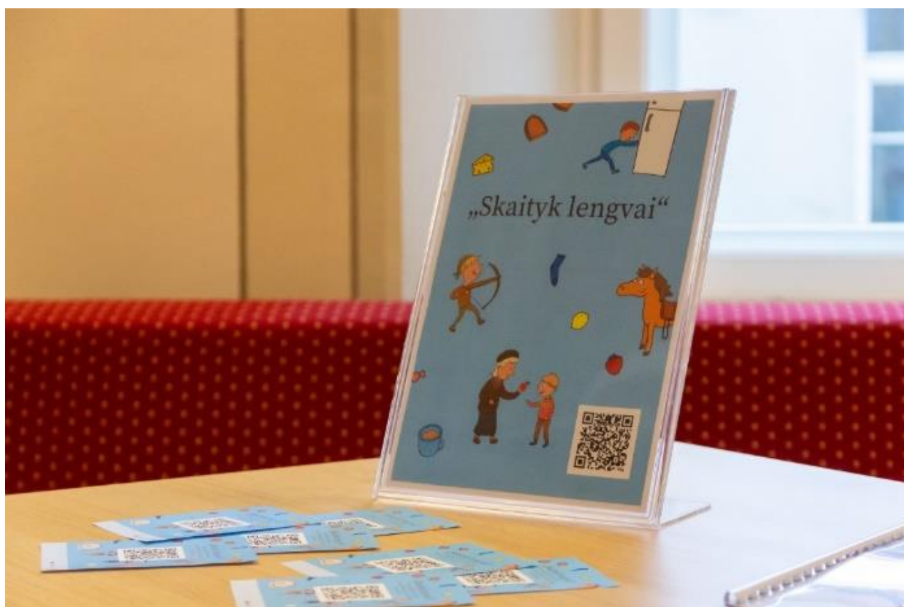
7 pav. „Skaityk lengvai“ projektas

Igyvendinome projektą „Skaityk lengvai“ (7 pav.), kurio metu surengti trys edukaciniai užsiėmimai – skaitymai lengvai suprantama kalba šeimoms, auginančioms vaikus, turinčius skaitymo sunkumų, išleistas el. leidinys – apsakymų rinkinys vaikams lengvai suprantama kalba, 3-uoju skaitymo lygiu (8 apsakymai – https://amb.lt/vaikams/data/public/uploads/2023/11/d2_skaityk-lengvai.pdf ), surengti mokymai Regiono bibliotekininkams lengvai suprantamos kalbos rašymo tema (2 vnt.).