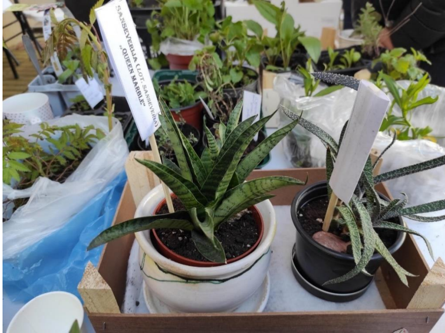
12 pav. Augalų atiduotuvė