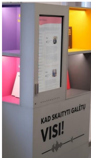
6 pav. Viena iš priemonių

Sukūrėme naujas, vykdėme tęstines paslaugas, pritaikytas negalia turintiems žmonėms (siūlėme 40 paslaugų).