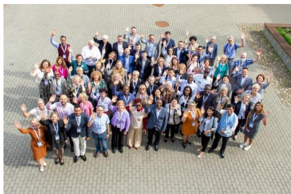
1 pav. EIFL Generalinės asamblėjos dalyviai

Skaitytojus pradžiuginome naujo dizaino pažymėjimais (2 pav.).