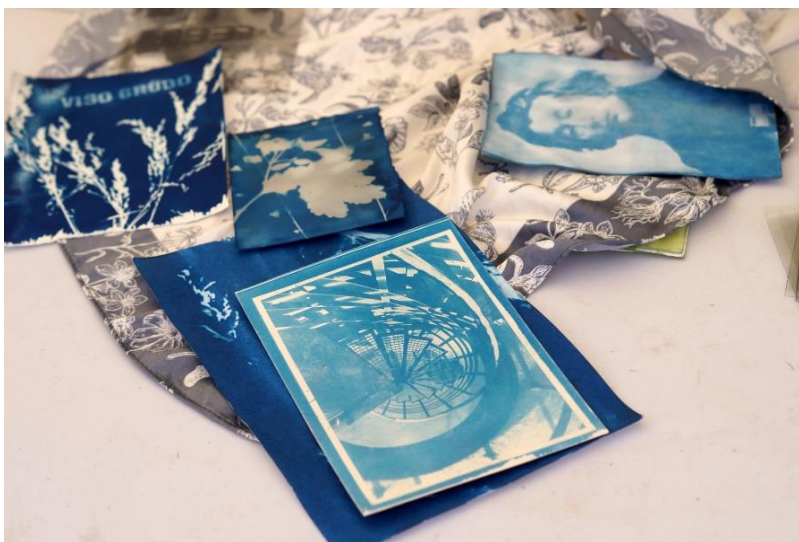
10 pav. Nuotrauka iš užsiėmimų

Į Regioną nukreipta 14 mobilių teminių parodų, su galimybe skolintis leidinius į namus. Tarpininkavome profesionalių autorių dailės parodų sklaidai Regione. Į Regiono bibliotekas taip pat išsiųstos 6 profesionalios dailės parodos. Elektrėnuose, Trakuose, Lentvaryje, Švenčionyse įvyko Šeimadienių, kaligrafijos edukacijos „Plunksna ir žodis“, Cianotipijos kūrybinių dirbtuvių jaunimui „Mėlyni šviesos paveikslai“, „Pinhole – lėtosios fotografijos kūrybinės dirbtuvės jaunimui“, „Bibliografinis rašto darbas“ edukaciniai užsiėmimai.