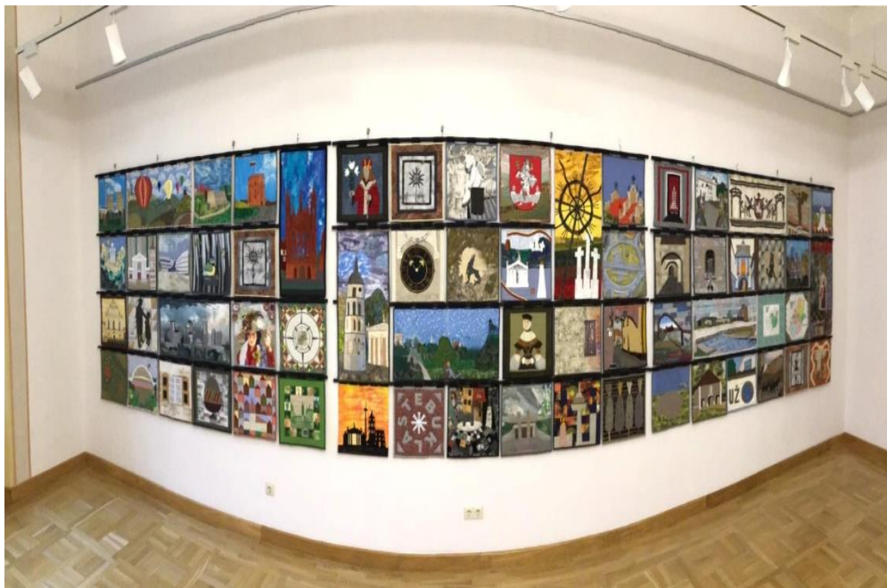
4 pav. „Vilniaus skiautinyš“

architektūra, tradicijos, gyvūnai ir žmonės. Vieną mėnesį veikusi paroda „Vilniaus skiautinyš“ sulaukė didžiulio lankytojų dėmesio (4 pav.).